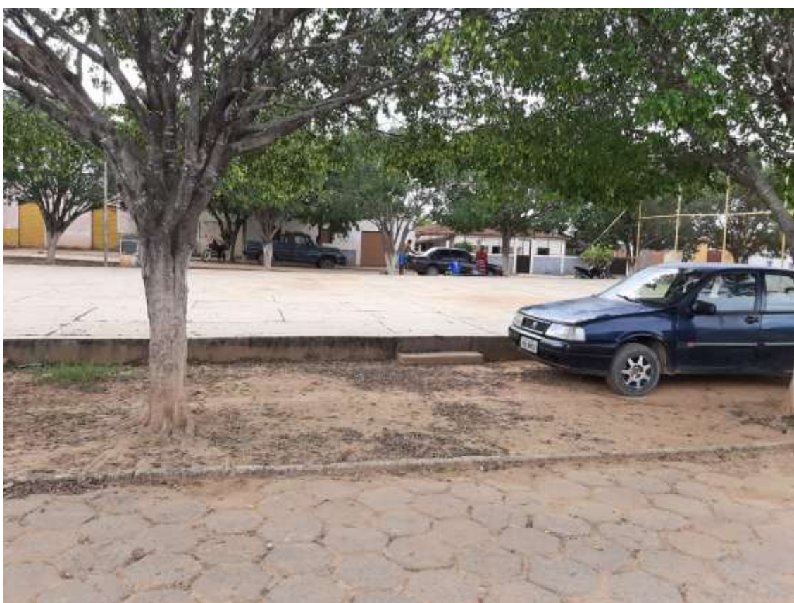
Figura 8 Centro da praça. Fonte: Acervo pessoal Acesso em: 03/02/2020.