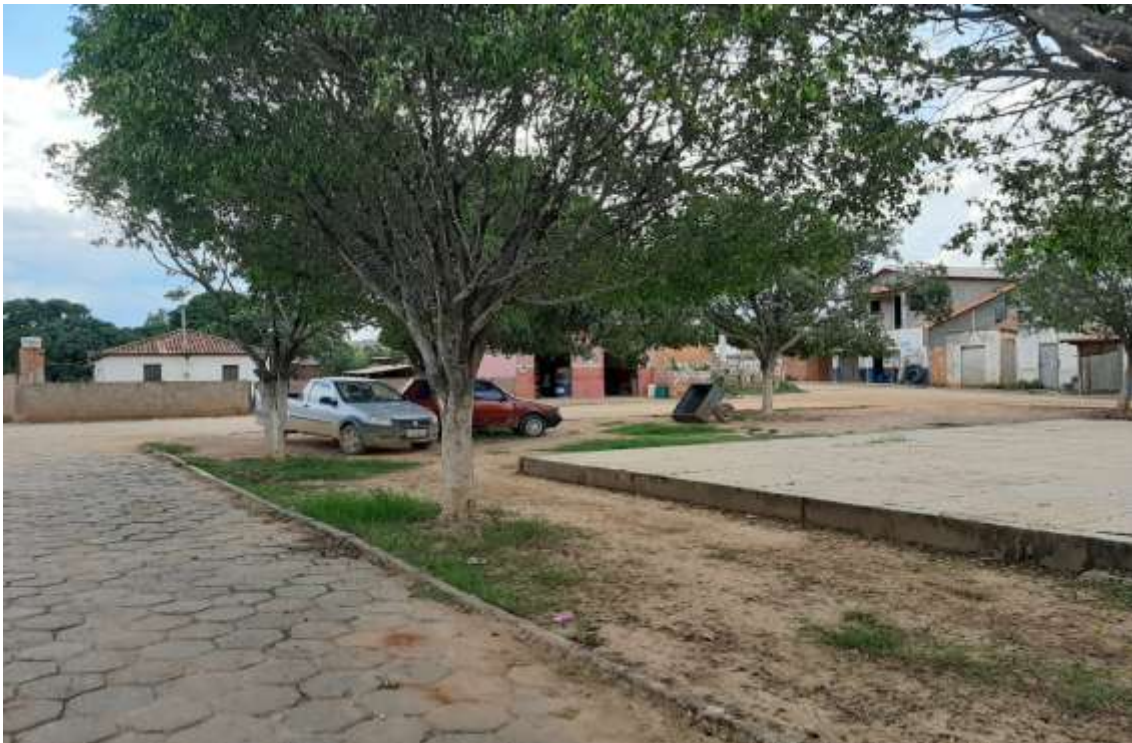
Figura 6 Vista do final da praça (partindo da saída para São João da Ponte). Fonte: Acervo pessoal Acesso em: 03/02/2020.