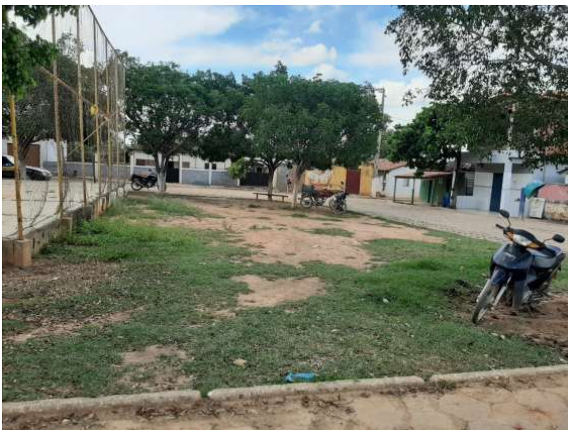
Figura 4 Vista do começo da praça (partindo da saída para São João da Ponte).

Fonte: Acervo pessoal Acesso em: 03/02/2020.