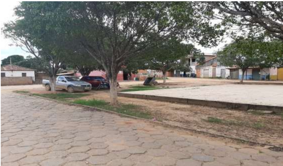
Figura 10 Vista do lado direito do final da praça (Referência saída para São João da Ponte) Fonte: Acervo pessoal Acesso em: 03/02/2020.