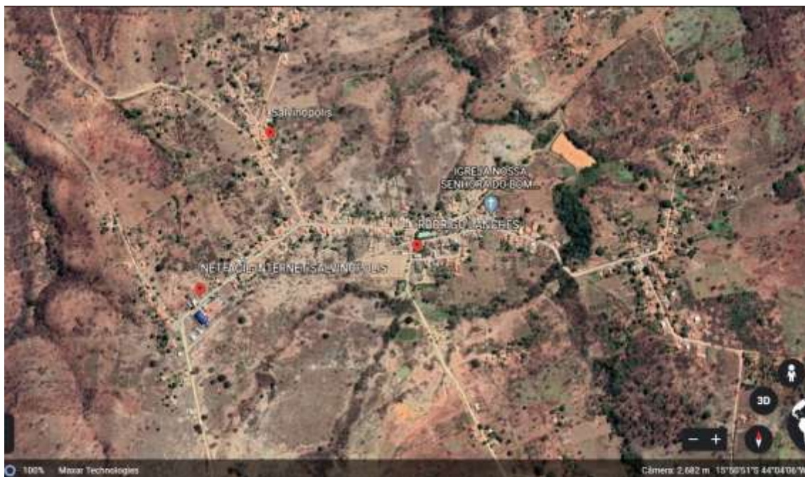
Figura 2 Vista aérea de Salvinópolis.