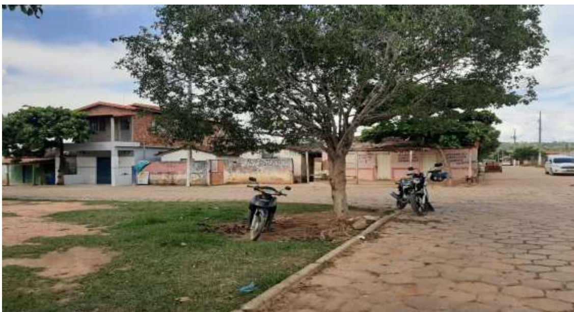
Figura 7