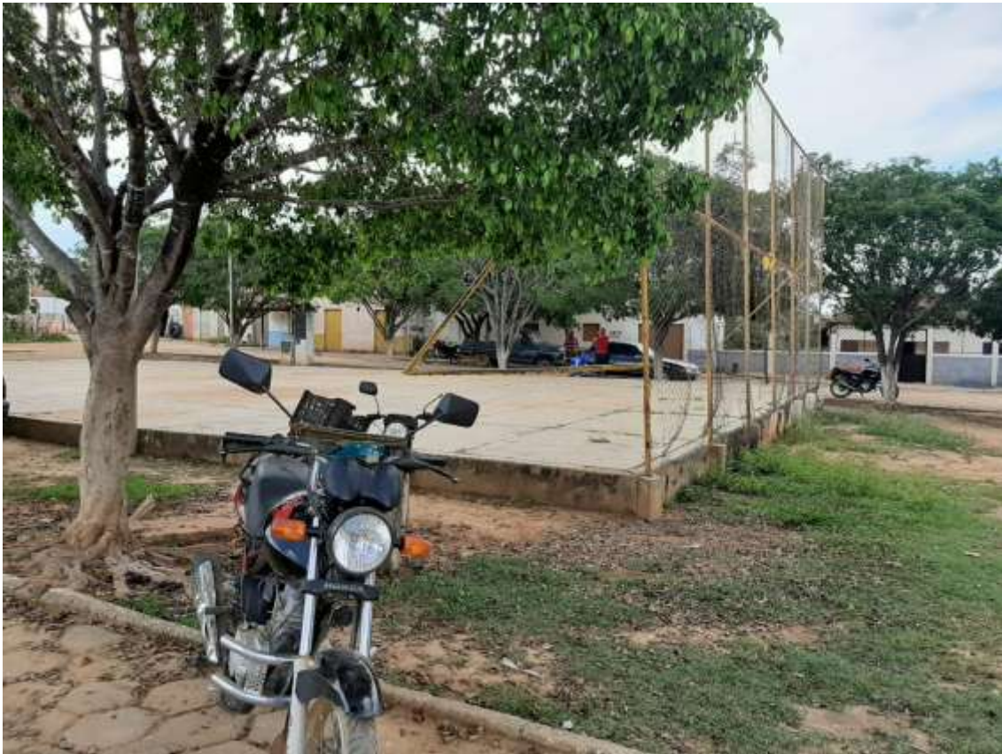
Figura 11 Vista do centro da praça.