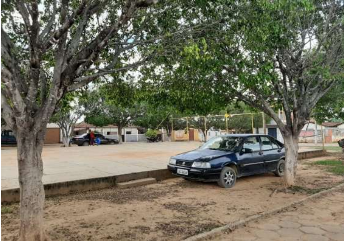
Figura 5 Vista do lado direito (Referência saída para São João da Ponte) Fonte: Acervo pessoal Acesso em: 03/02/2020.