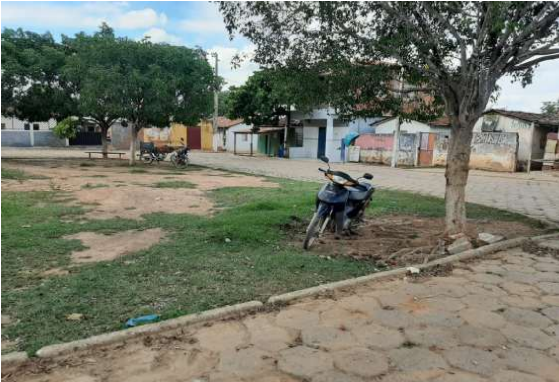
Figura 9 Vista do lado direito do início (Referência saída para São João da Ponte) Fonte: Acervo pessoal Acesso em: 03/02/2020.