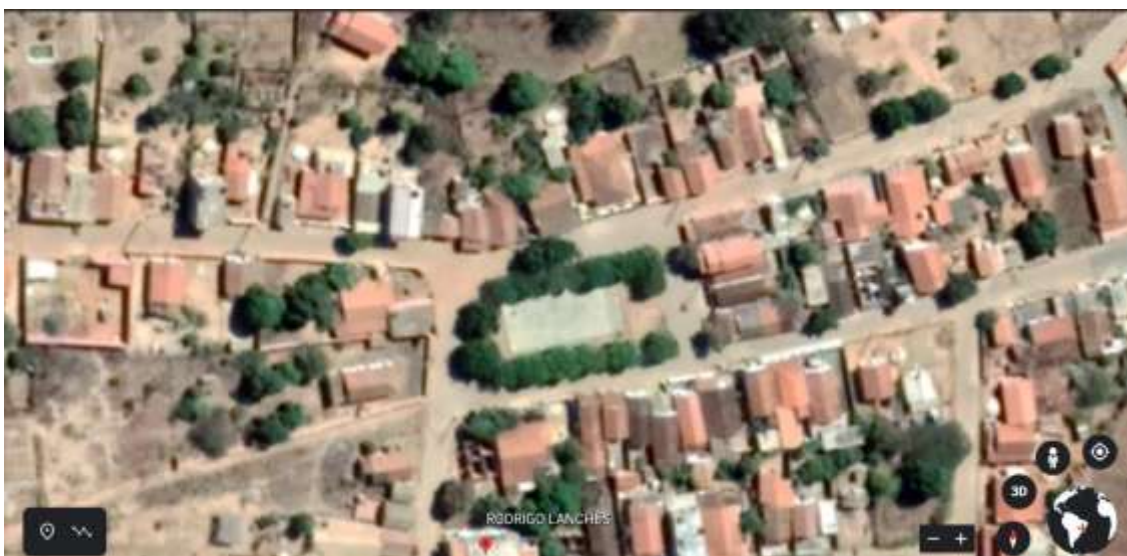
Figura 3 Vista aérea da Praça.